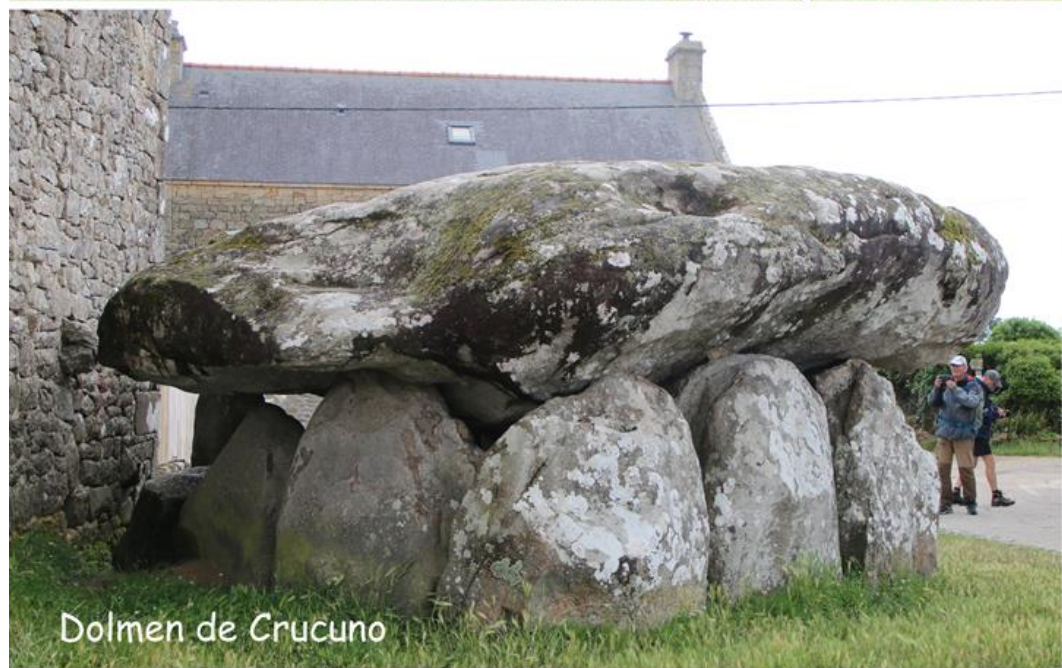
Dolmen de Crucuno