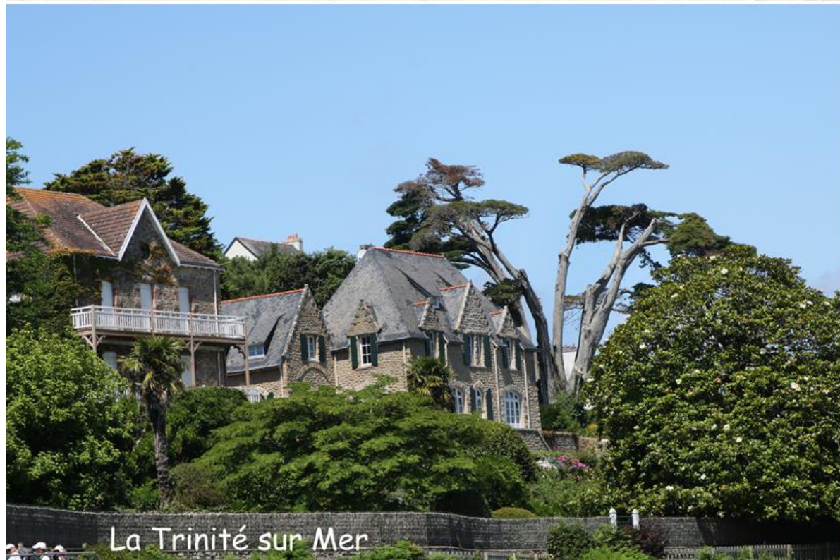
La Trinité sur Mer