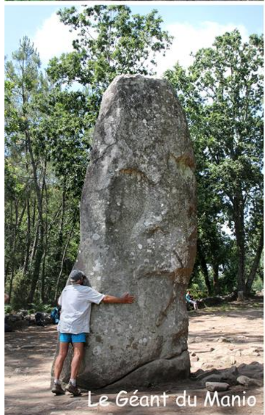
Le Géant du Manio