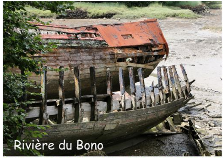
Rivière du Bono