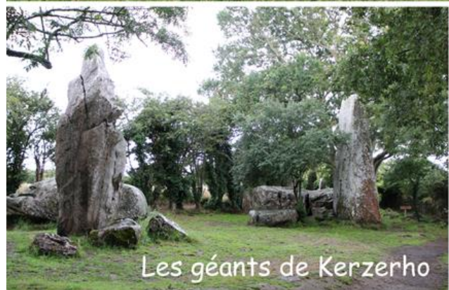
Les géants de Kerzerho