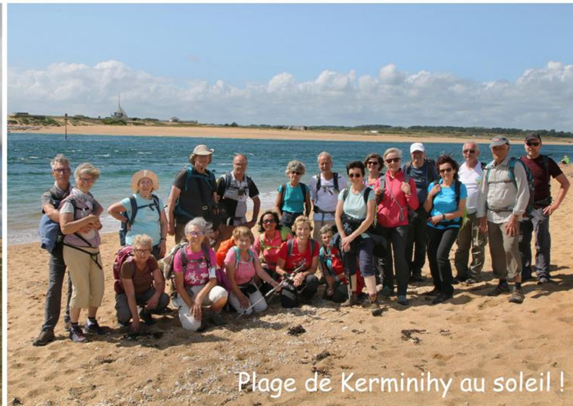
Plage de Kerminihy au soleil !