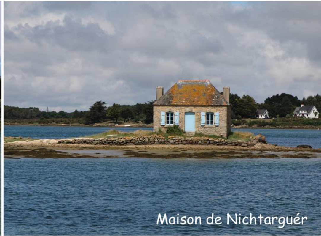
Maison de Nichtarguér