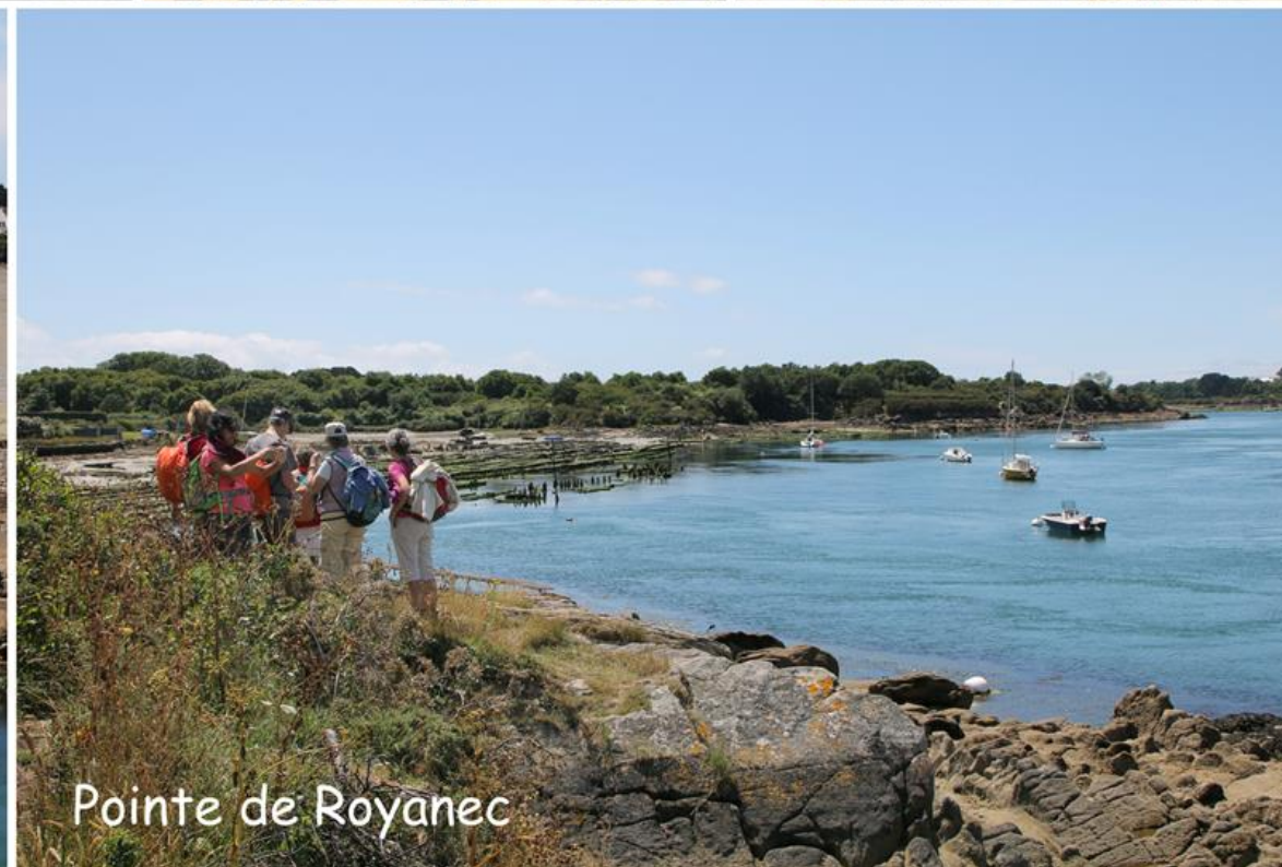
Pointe de Royanec