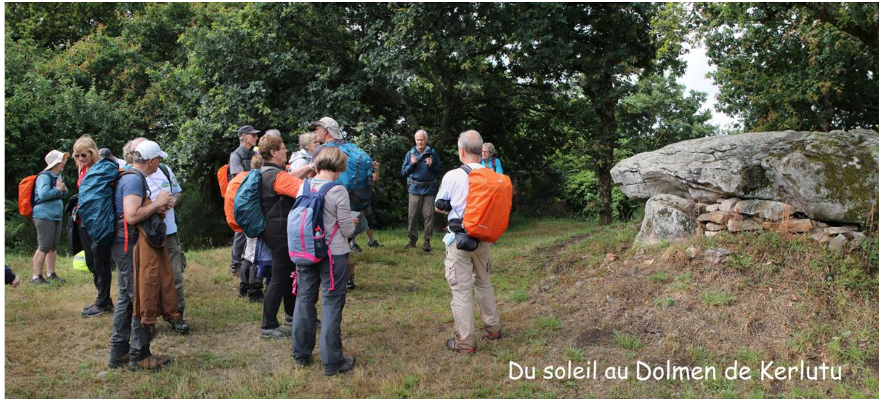
Du soleil au Dolmen de Kerlutu