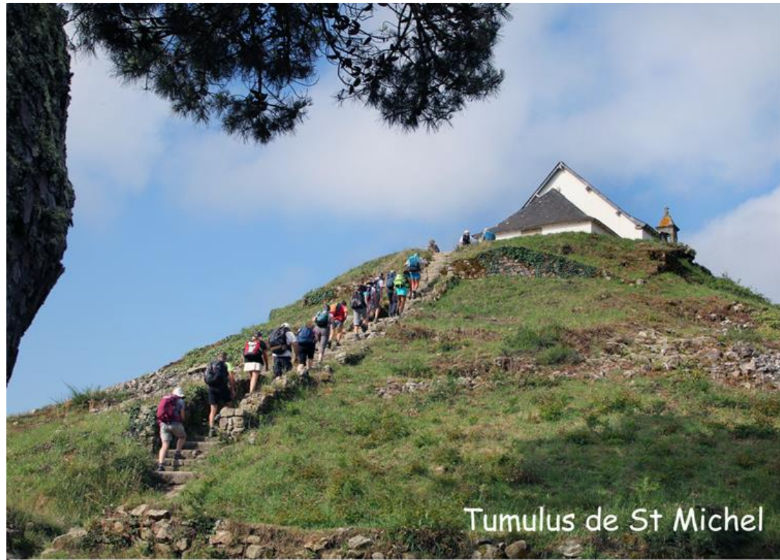
Tumulus de St Michel