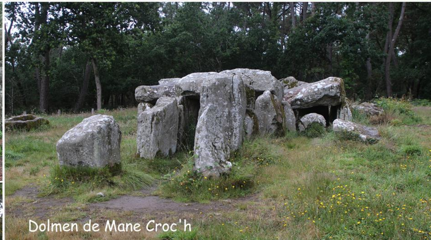
Dolmen de Mane Croc'h