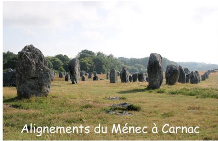
Alignements du Ménéac à Carnac