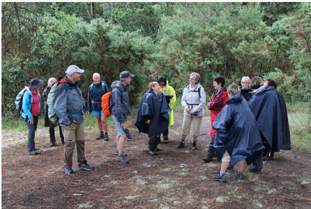
Dolmen de Mane Braz