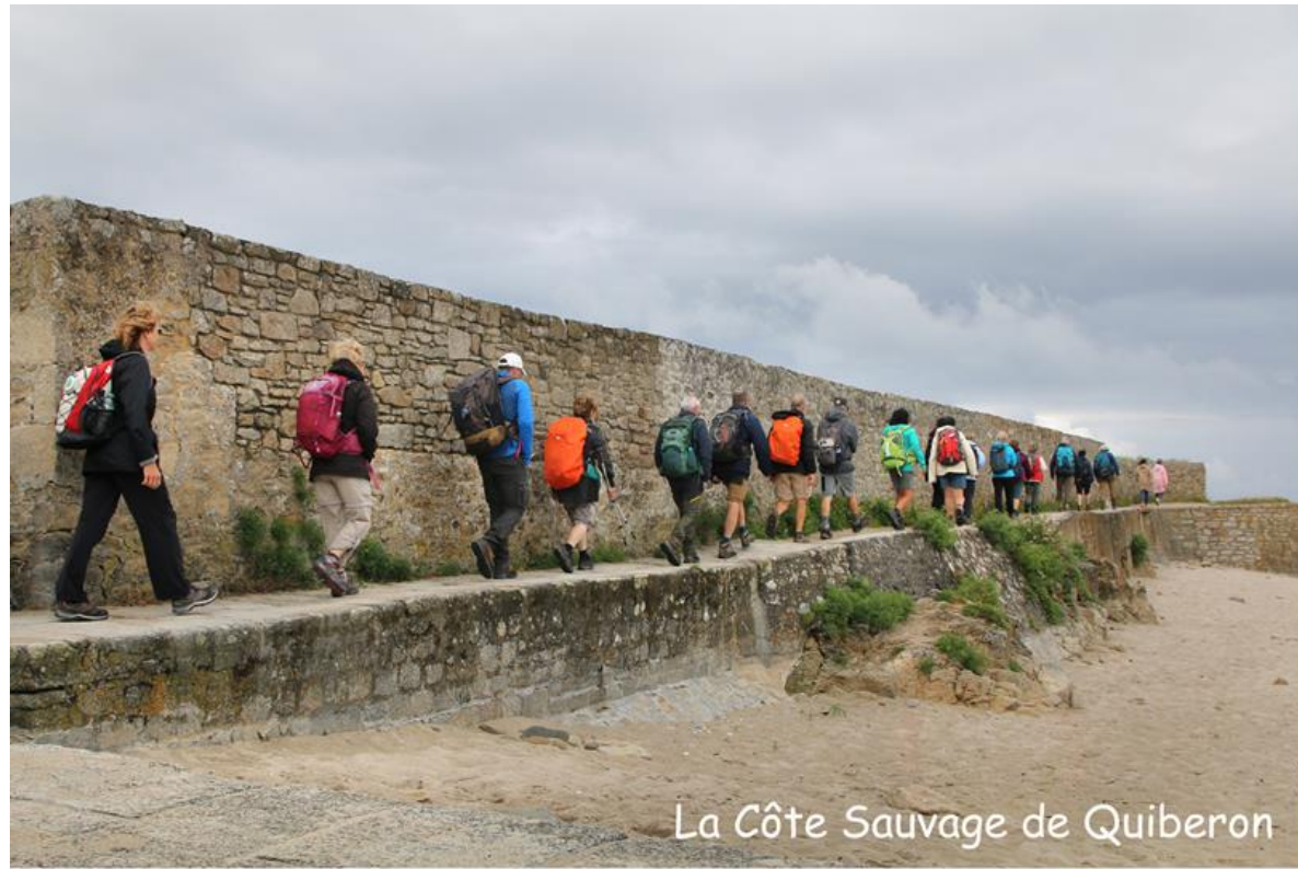
La Côte Sauvage de Quiberon