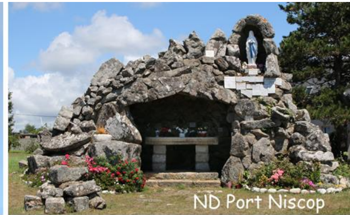
ND Port Niscop