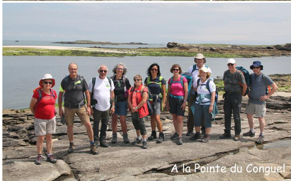
A la Pointe du Conguel