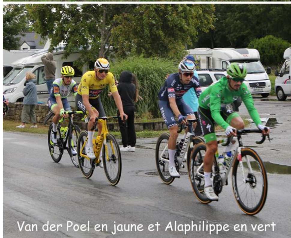
Van der Poel en jaune et Alaphilippe en vert