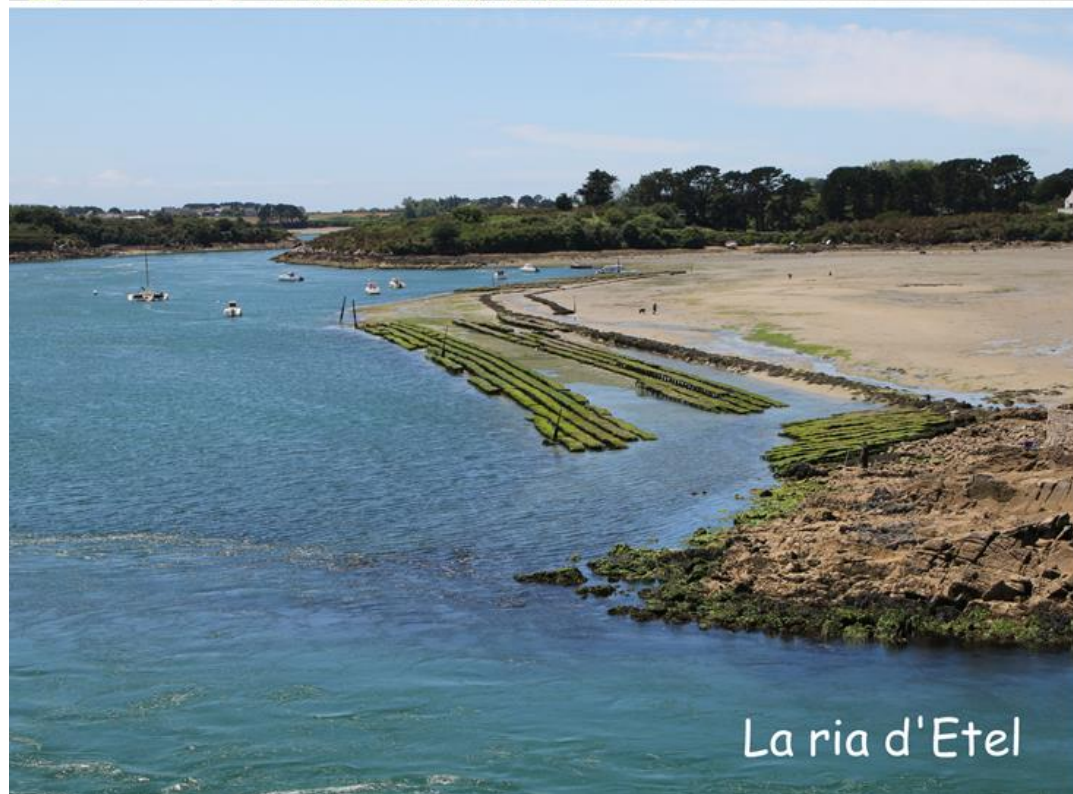
La ria d'Etel