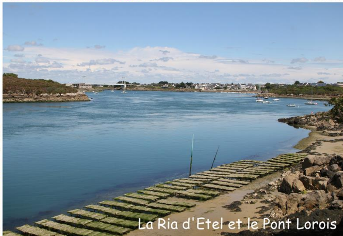
La Ria d'Etel et le Pont Lorois