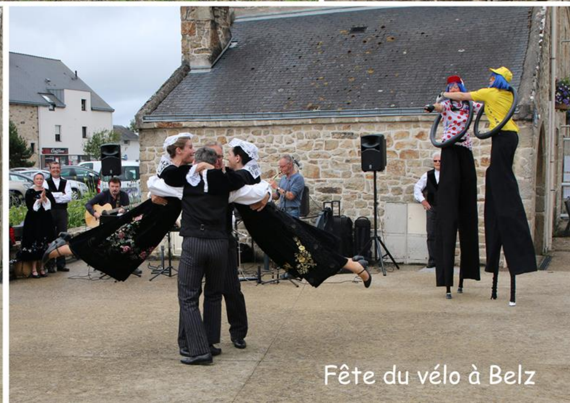
Fête du vélo à Belz