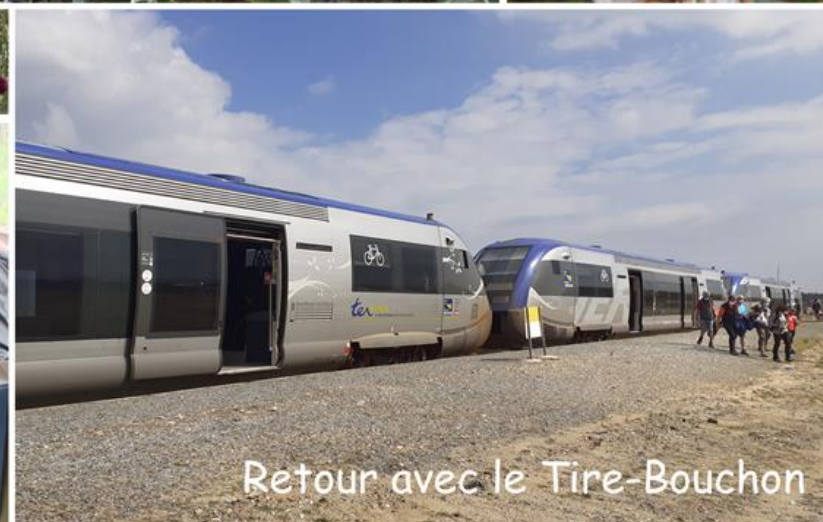
Retour avec le Tire-Bouchon