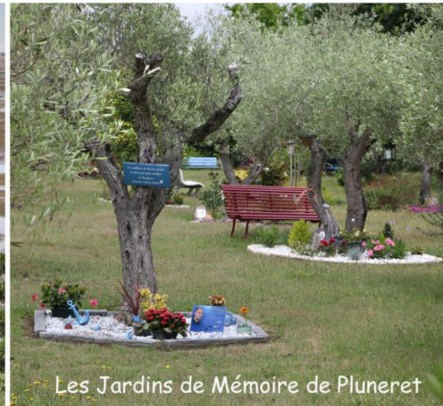
Les Jardins de Mémoire de Pluneret