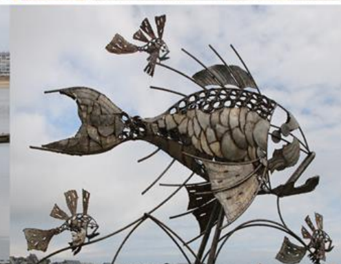
Arrivée à Quiberon