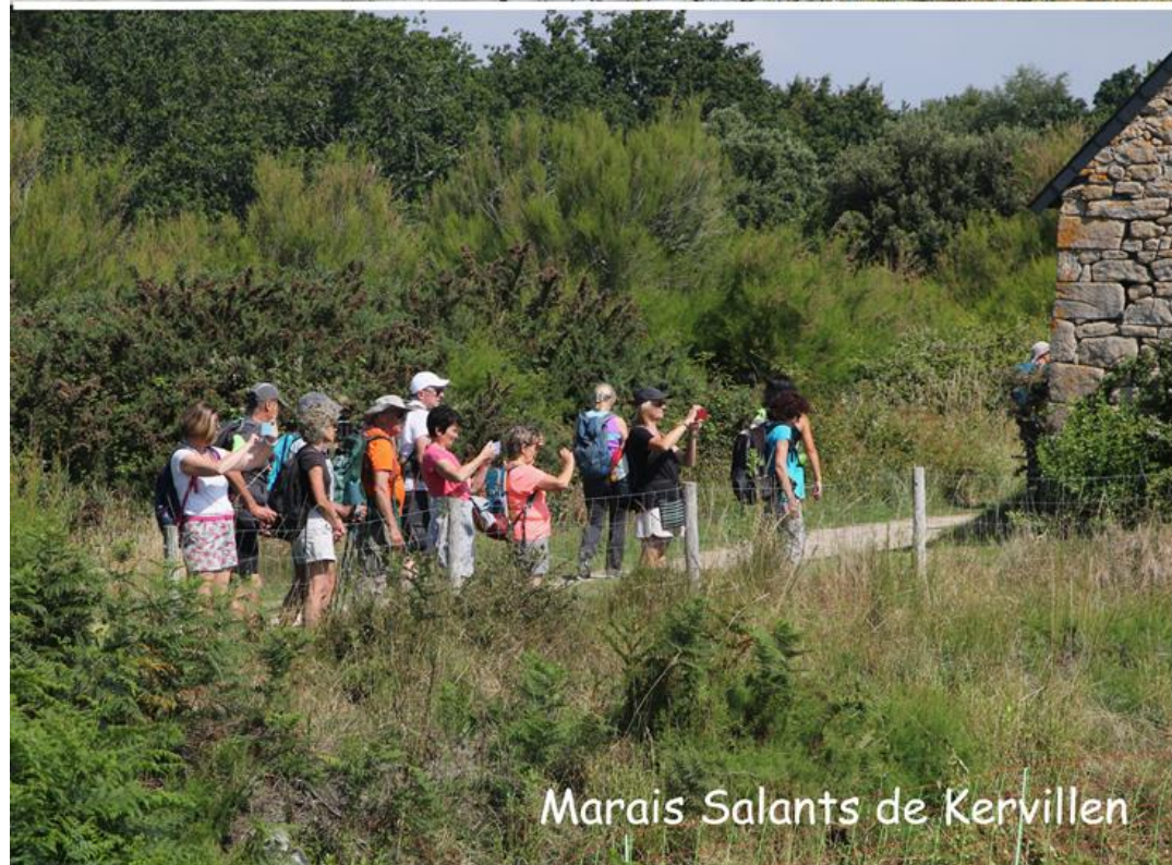
Marais Salants de Kervillen