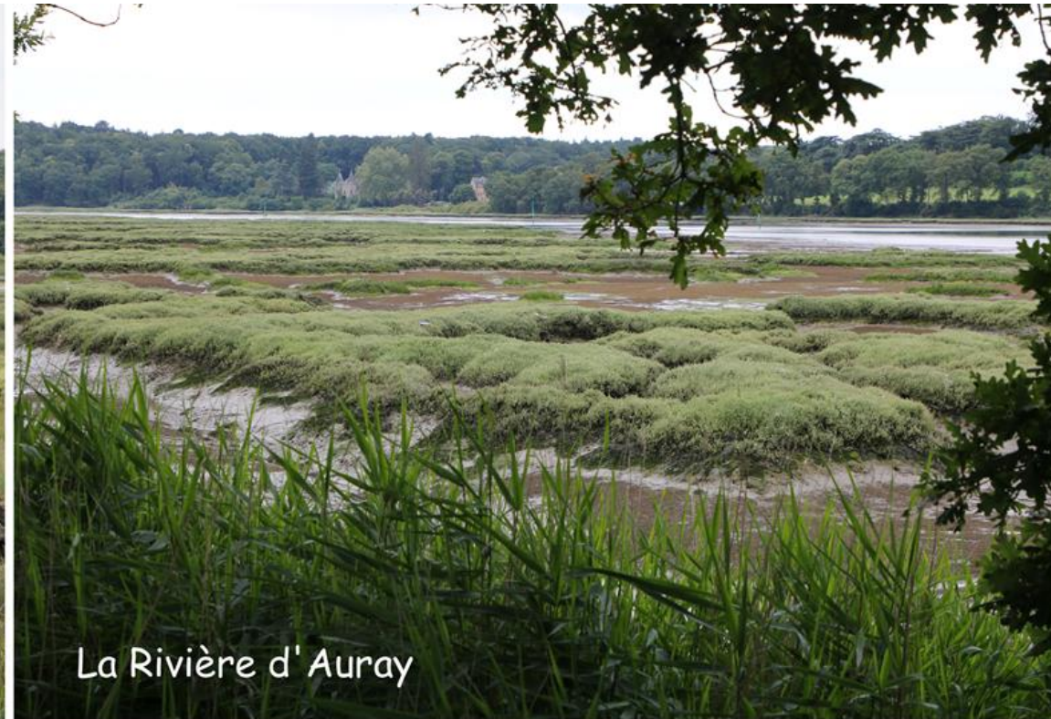
La Rivière d'Auray