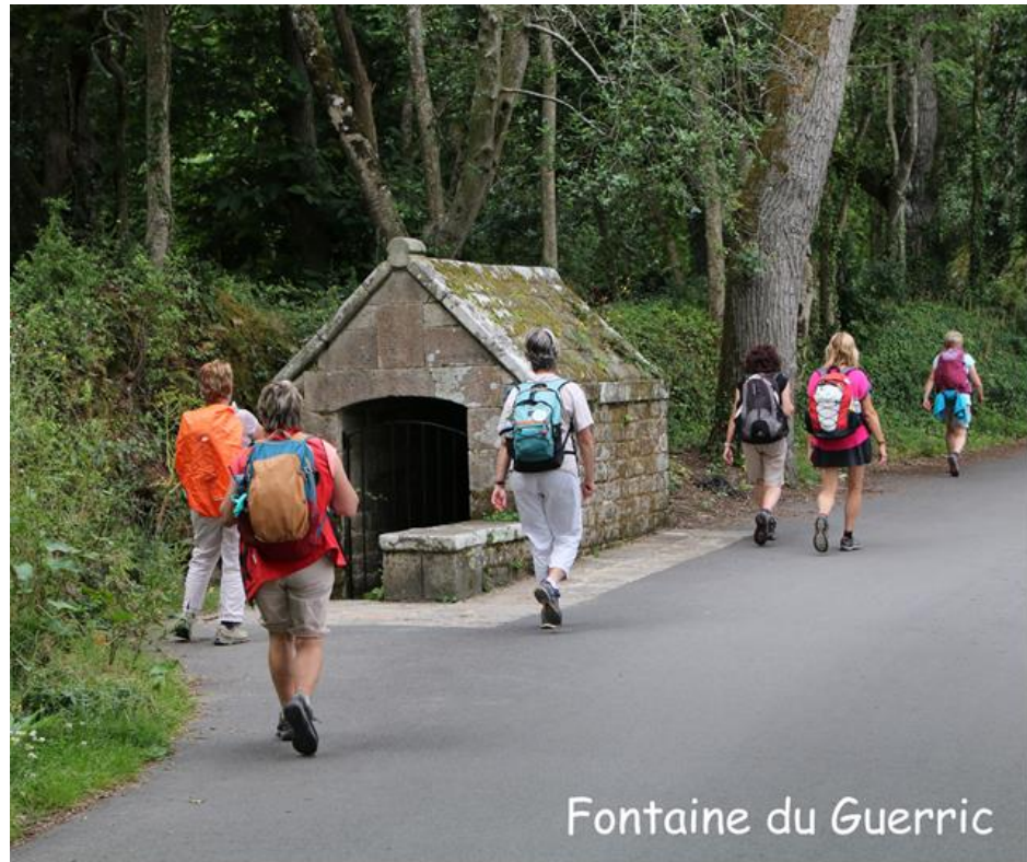
Fontaine du Gueric