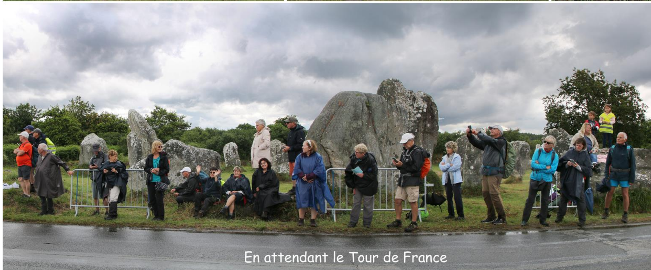
En attendant le Tour de France