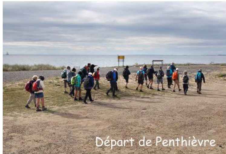
Départ de Penthièvre