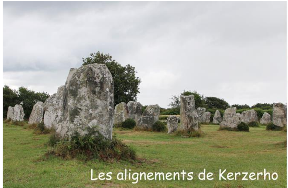
Les alignements de Kerzerho