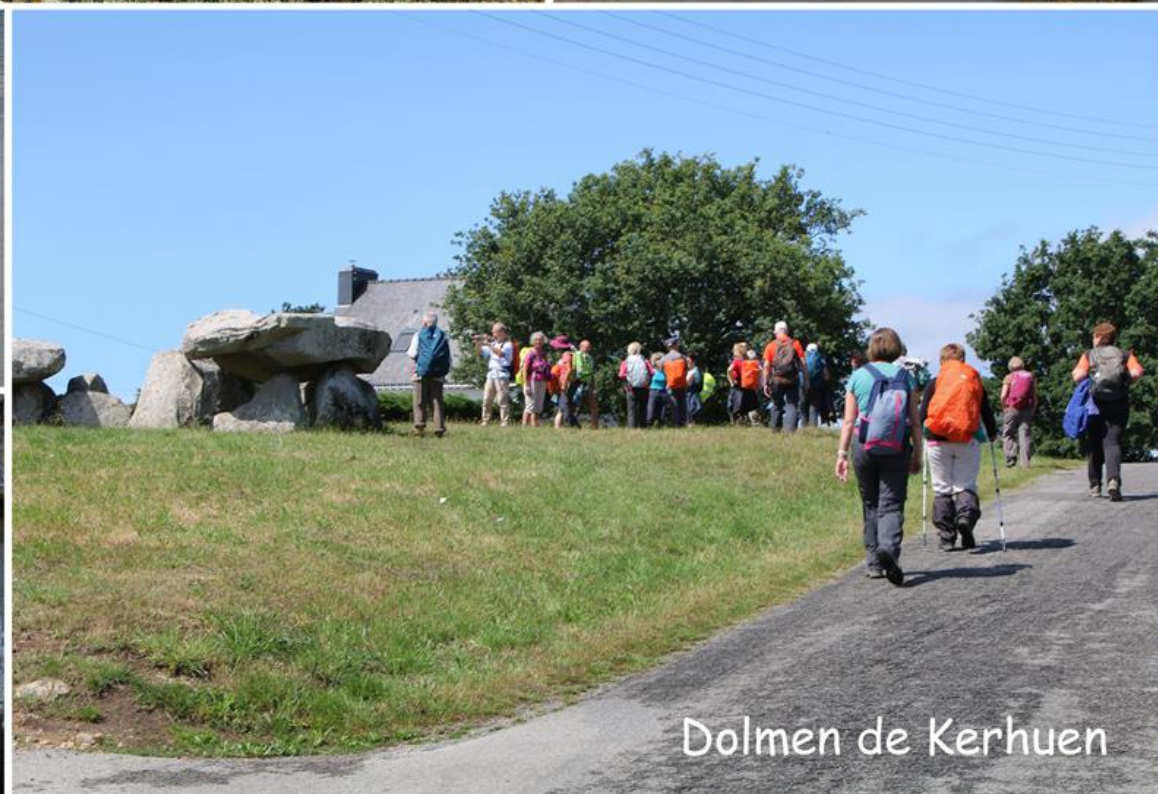
Dolmen de Kerhuen