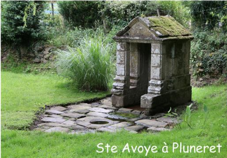
Ste Avoye à Pluneret