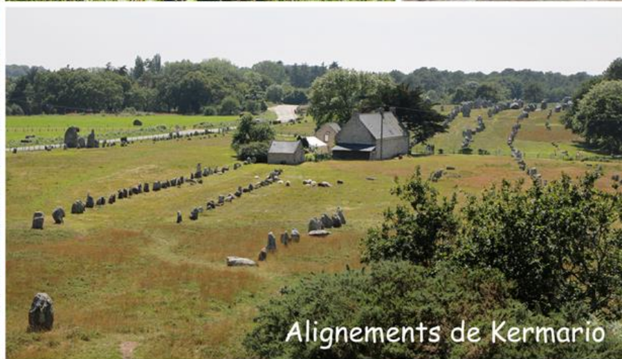
Alignements de Kermario