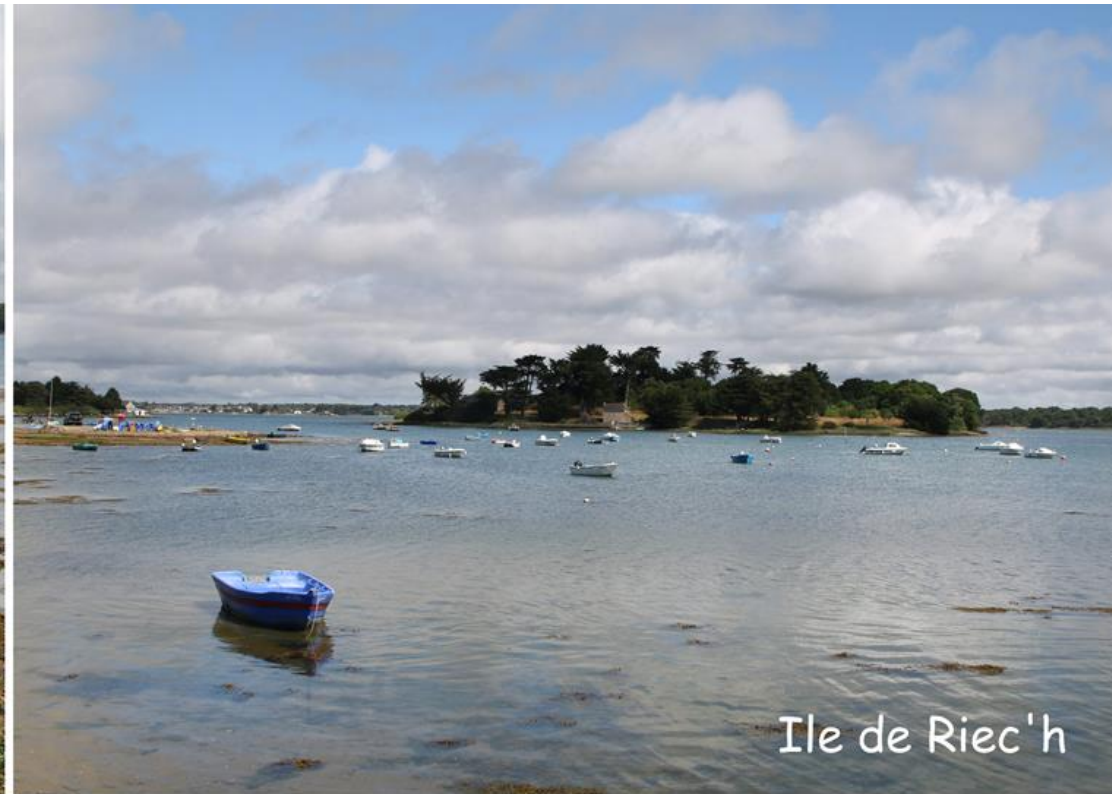
Ile de Riec'h