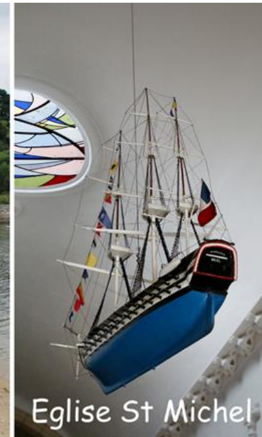
Eglise St Michel