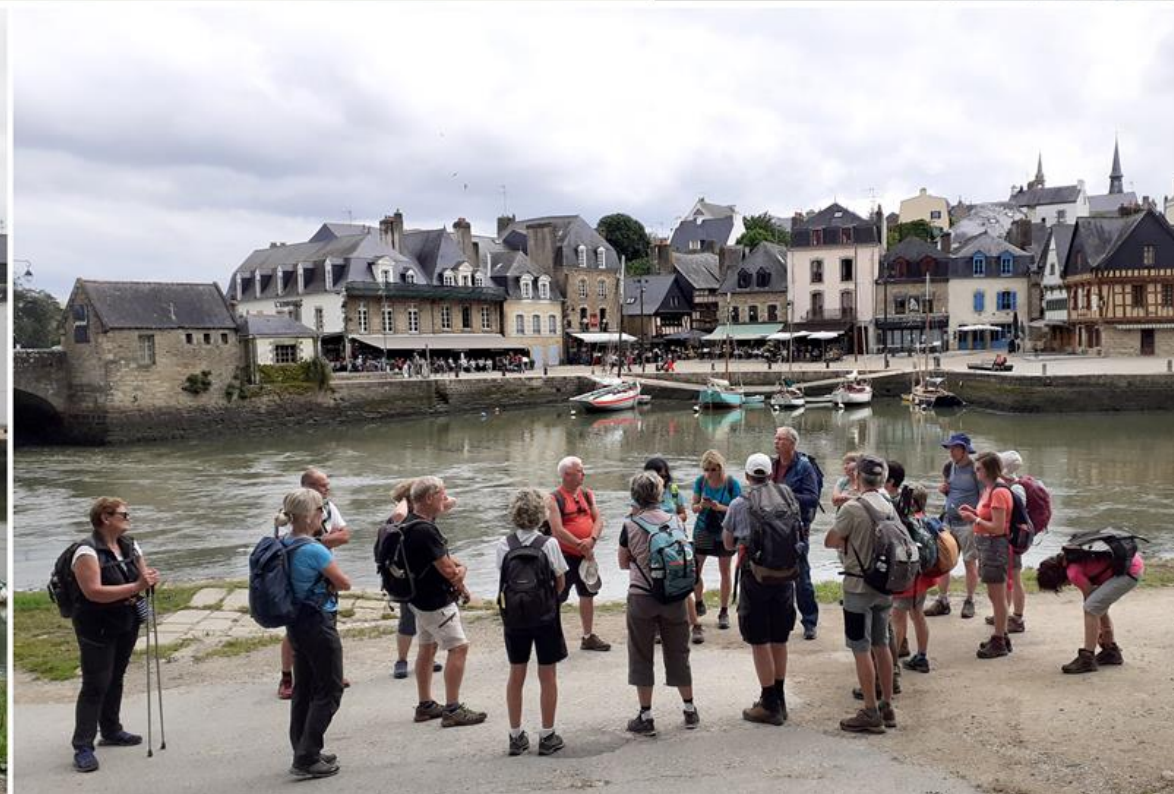
Port de St Goustan