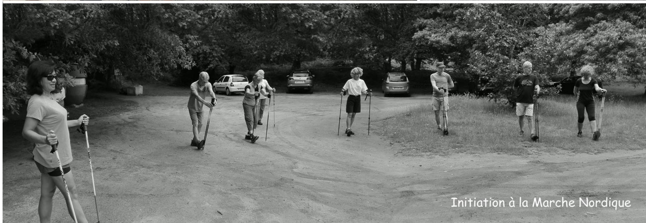
Initiation à la Marche Nordique