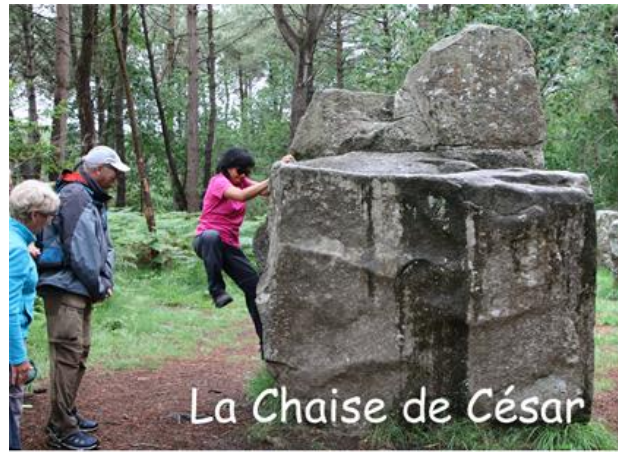
La Chaise de César