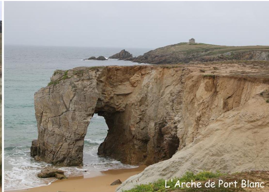
L'Arche de Port Blanc