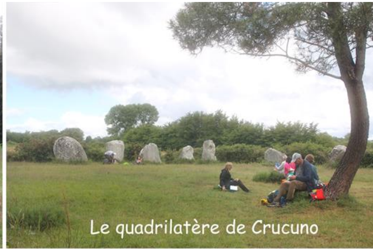
Le quadrilatère de Crucuno