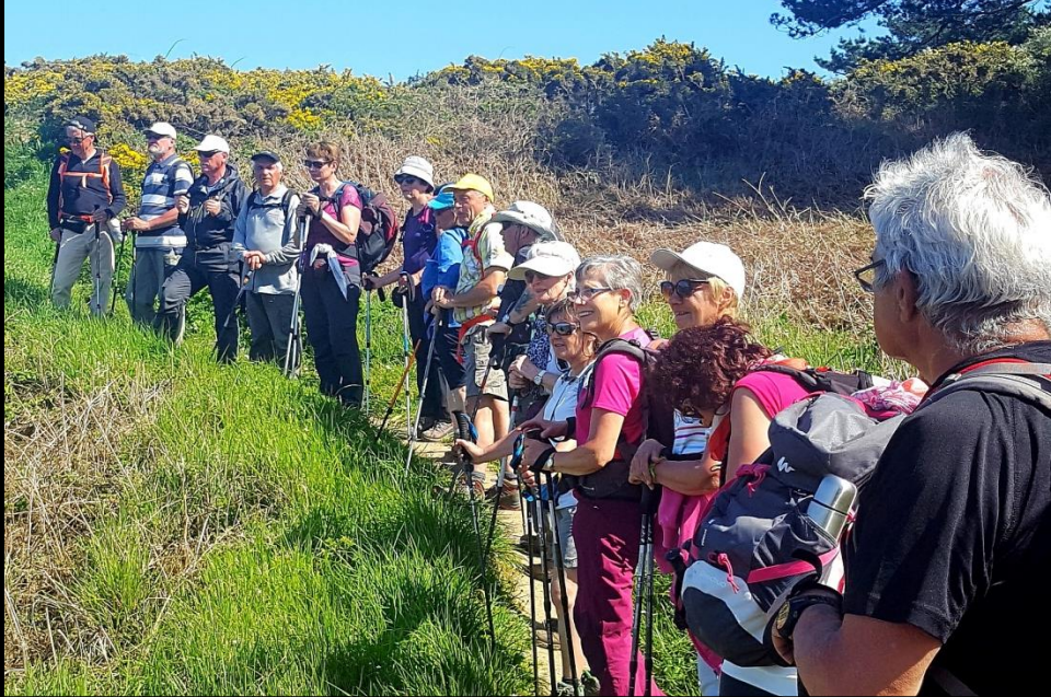
Ancien sémaphore vers Pointe des Poulains