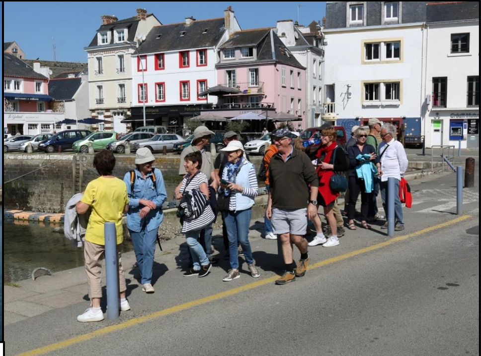
Arrivée au Palais