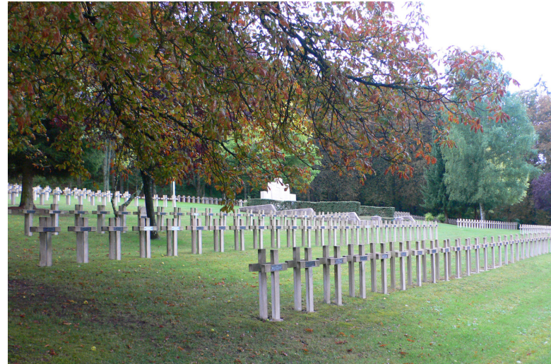
Nécropole nationale Du TROTTOIR .