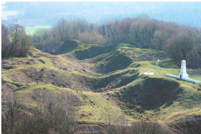
Butte de VAUQUOIS