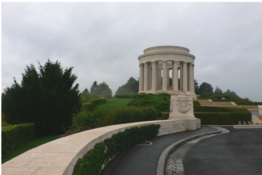
Monument symbolisant la coopération des armées Françaises et Américaines.