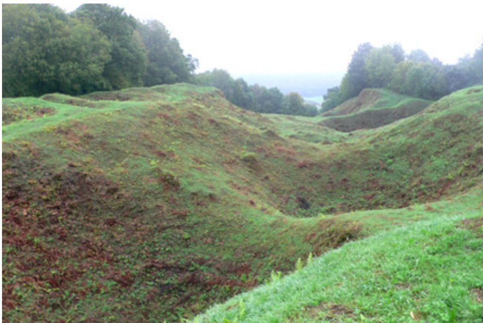
Butte de VAUQUOIS