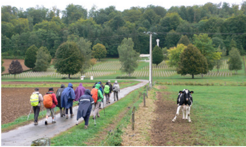
Nécropole nationale de MARLOTTE .