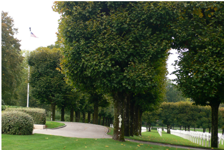
ARGONNE, le plus grand cimetière Américain d'Europe