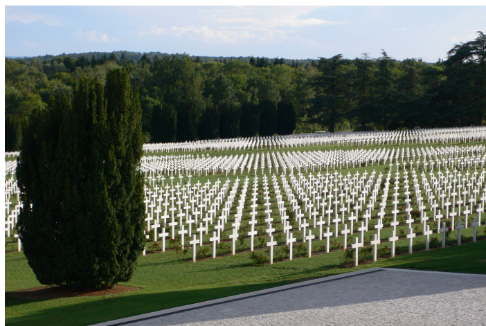
Nécropole nationale de DOUAUMONT.