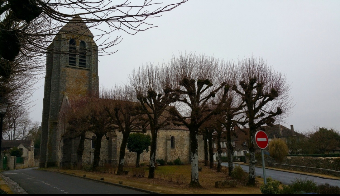
Torffou son église et sa bibliothèque