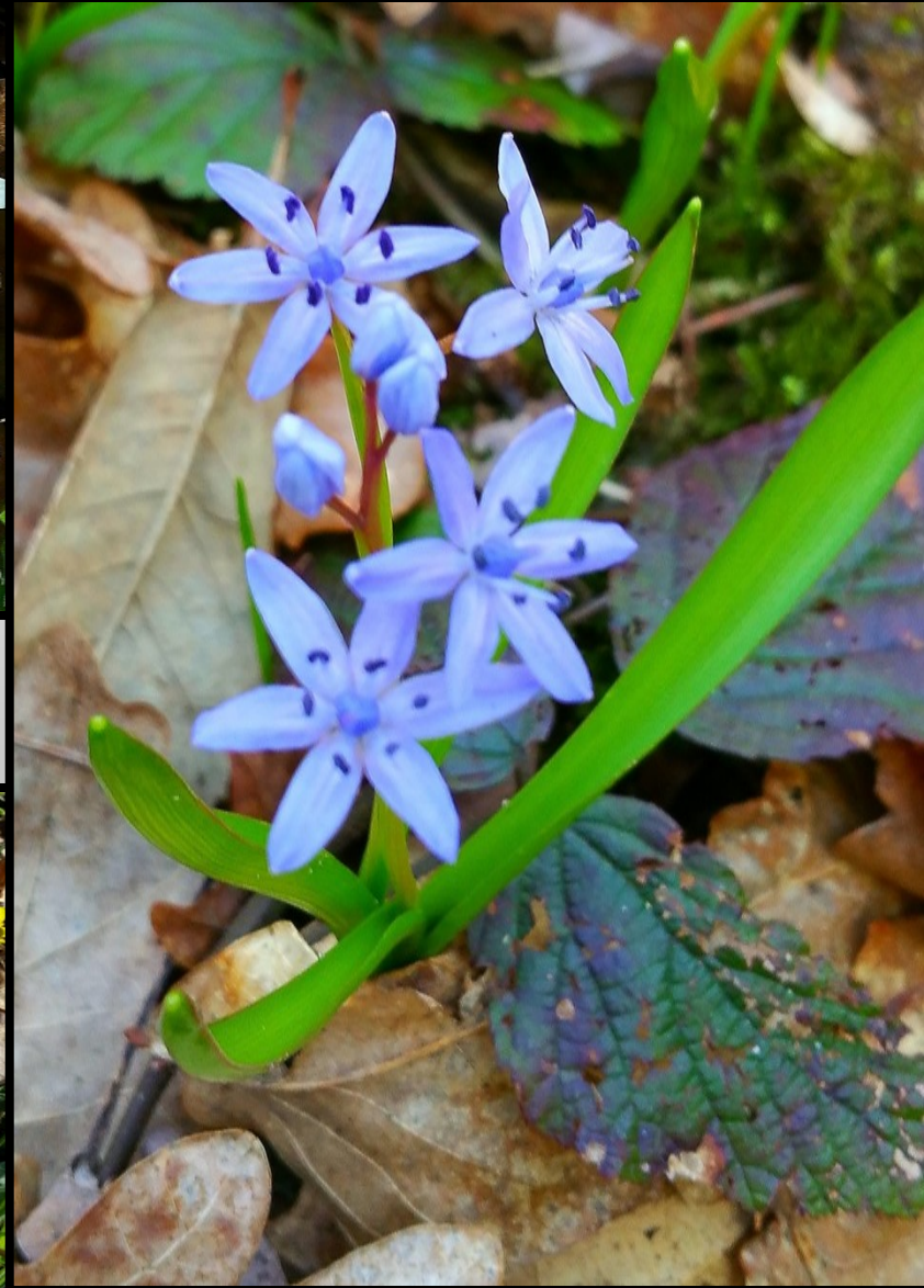
Les fleurs du printemps : ci-dessus des anémones, à droite la Scilla bifolia et ci-dessous des ficaires