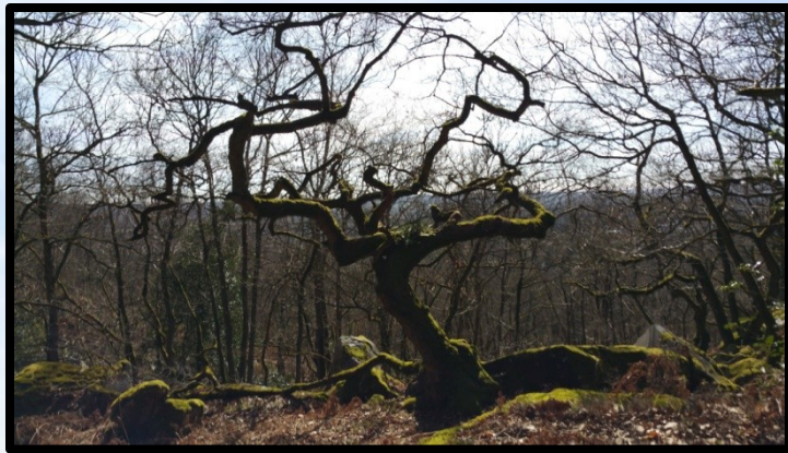
Pause au du Belvédère de Chamarande