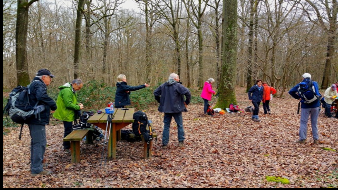
Picnic avec un rayon de soleil dans la Forêt Domaniale de Champagne