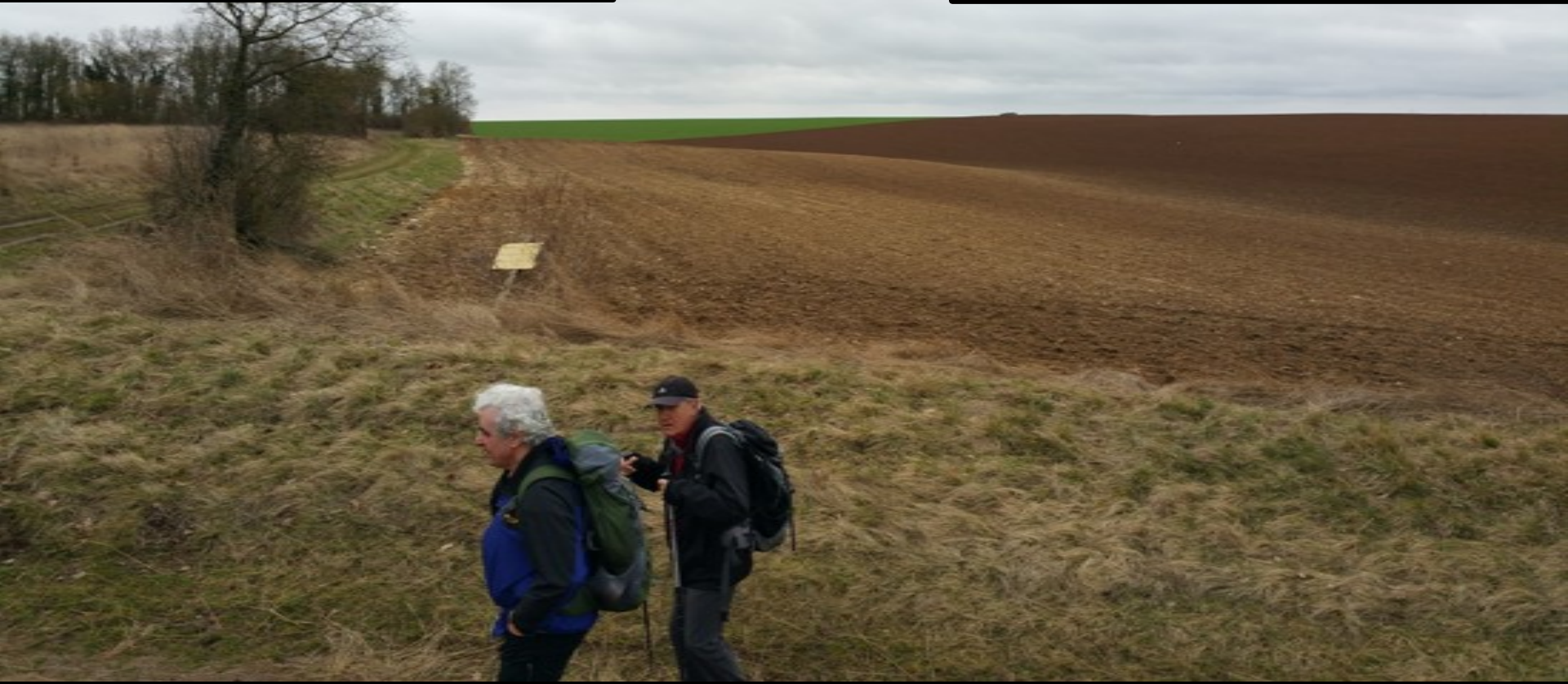
Vers la vallée Vigneron