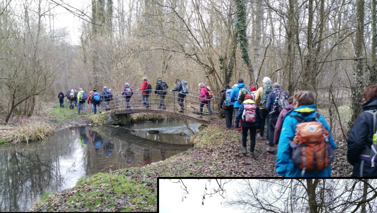
Traversée de la Chalouette