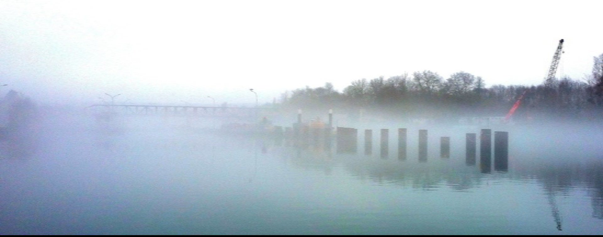
L'écluse en travaux de Boissise-le-Roi dans la brume et la mairie.